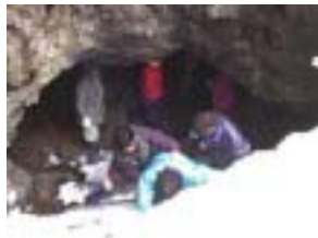
洞窟では何と出会えるかな