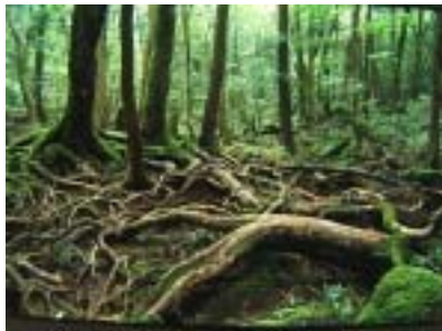
樹海の森では 動植物の生命力あふれた姿に驚かされます

足元の自然を注意深く見てみましょう 微生物から巨木まで。そして昆虫から熊まで・・・ 自然に包まれた「今」という空間には 動植物の生命力の偉大さと ゆったりとした時間と空間の流れを感じます