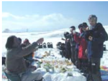
冬でも雪上レストランで楽しめます