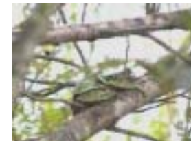
モリアオガエルの雄と雌