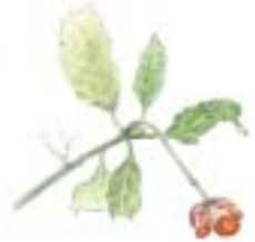
細密画の描法で観察をする