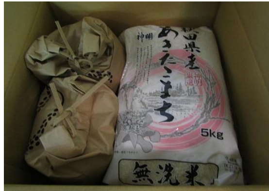
(株)ニールズヤードレメディーズ様よりの、食料品（お米、お菓子類）