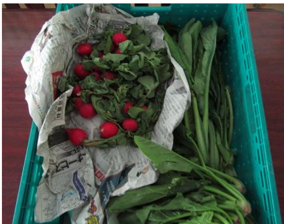
生長の家様より野菜類のご提供