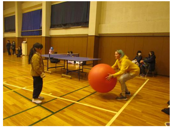
今回は、「エーススポーツクラブ」の皆さん方による室内スポーツやゲームの企画実施