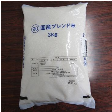
川越麗子様よりお米 3kg 提供