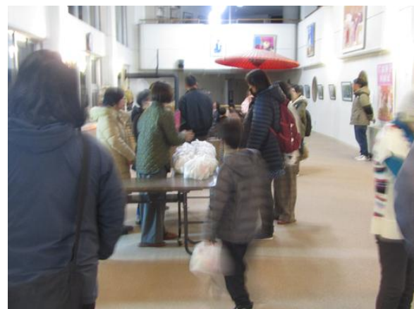
お持ち帰り品の配布