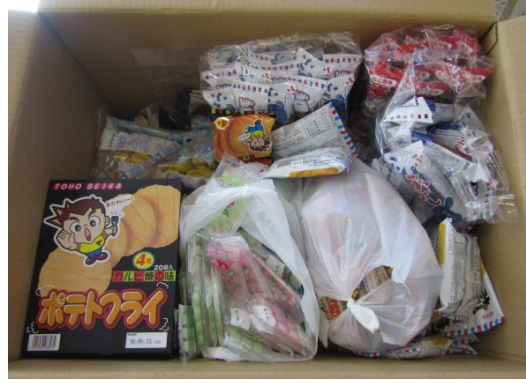
ホテル鐘山苑様より頂いたお菓子類