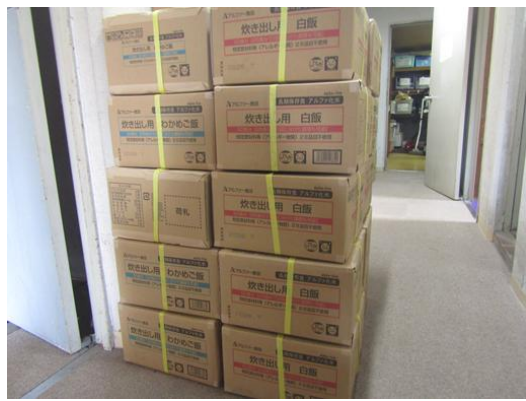
富士吉田市より頂いたアルファ米 50箱