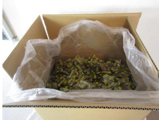
NPO 法人富士と緑のフードサポート様より牛乳パック 768 パック、お菓子 3 箱ご提供