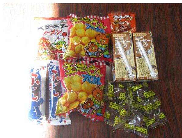
子供たちにお持ち帰りお菓子、コーヒーミルク詰め合わせ