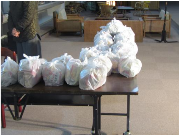
お持ち帰り品の準備