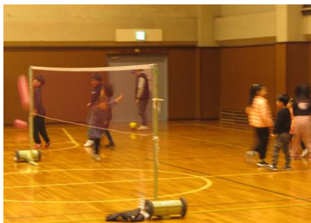
食後の運動、お母さん達と一緒に、卓球・バドミントン・バスケット体験