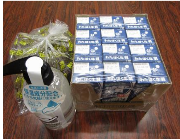
本日のお持ち帰り品、牛乳・お菓子・ハンドソープ