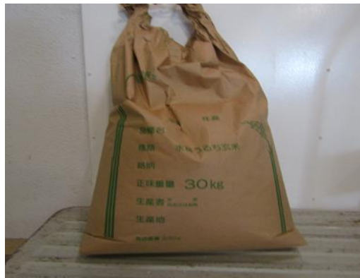
北口本宮富士浅間神社様、松尾神社様よりお米の提供