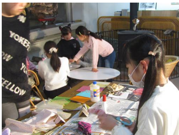
お雛様の顔はピカチュウにしたの！