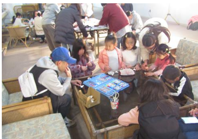
着物の色は！ なに色にしようかな？