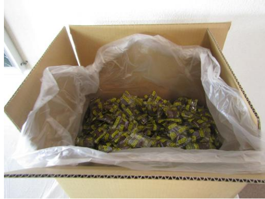
NPO 法人富士と緑のフードサポート様より牛乳パック 768 パック、お菓子 3 箱ご提供