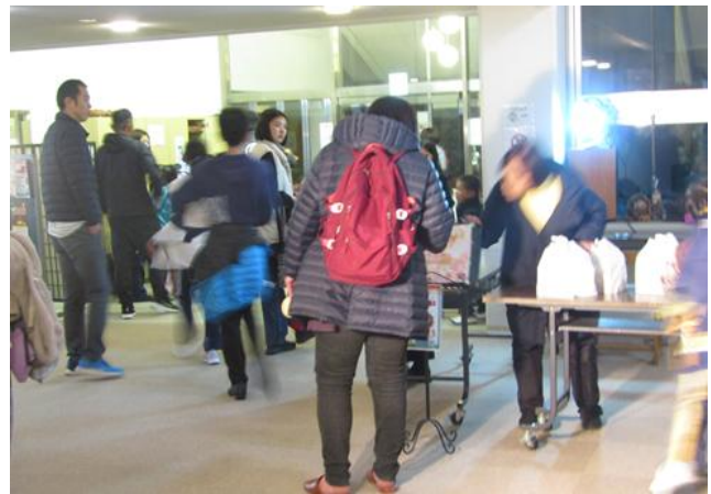
いつもありがとうございます。「子供が牛乳大好きなの」「また来るね」