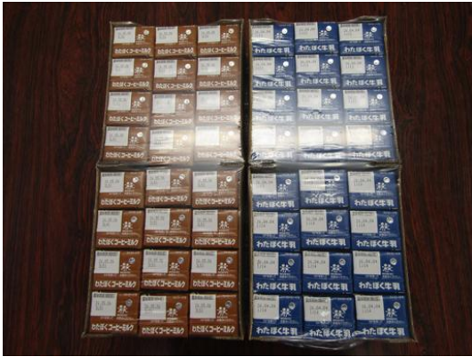
NPO 法人富士と緑のフードサポート様より 牛乳パック 768 パック、ご提供