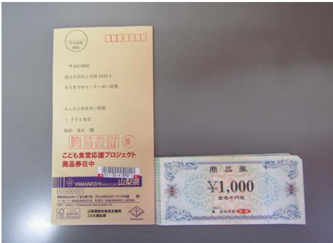
山梨県総合県民支援局子ども福祉課様ご提供、商品券 20,000 円は JA にて梨北米 20kg 購入