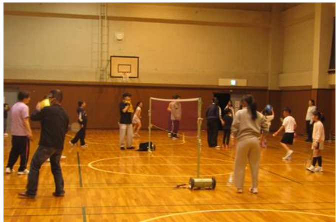
食後の運動、お母さん達と一緒に、卓球・バドミントン・バスケット体験