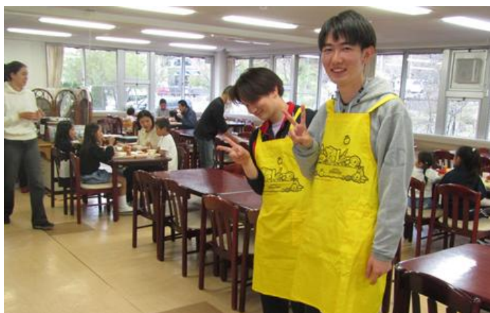
子ども食堂案内人、ピカチュウのエプロンが良く似合う