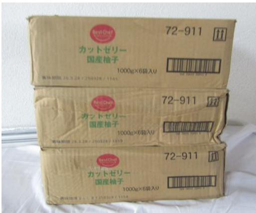
(株)HAMAYOU リゾート様より柚子ゼリーの ご提供