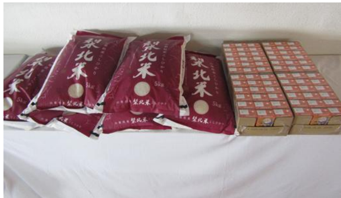
やまなし子ども地域食堂サポートセンター様よりお米 30kg とミカンジュース 72 パックのご提供