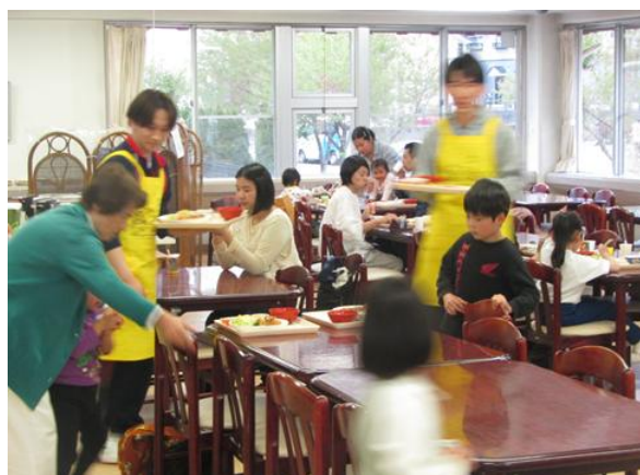
友達同士で食べるとおいしいね！