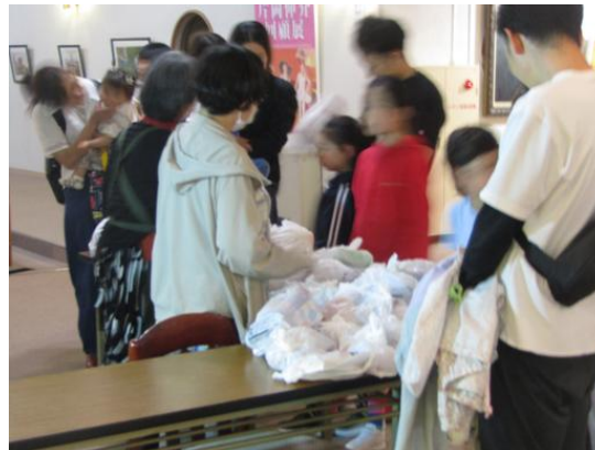
お土産品（お持ち帰り品）渡し、各御家庭とお子様全員に