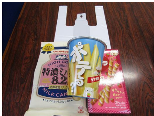
各御家庭へのお持ち帰り品と子供たち全員へのお菓子詰め合わせの一例