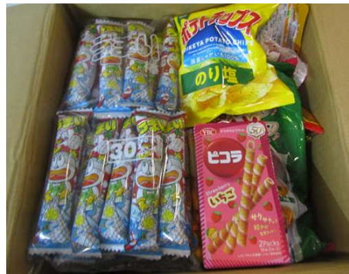
(株)ニールズヤードレメディー様より調味料、お菓子類のご提供