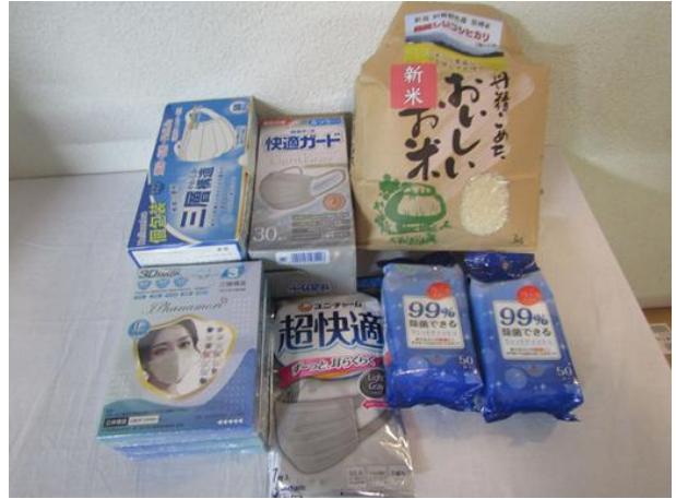
(株)ニールズヤードレメディー様より調味料、食料品、衛生用品のご提供