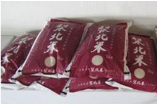
やまなし子ども地域食堂サポートセンター様よりのお米は「みんなの食堂」に使用させて頂きました。