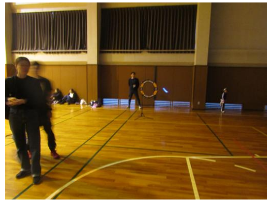
実際にドローンを操縦したり、障害物をクリアしながらの操縦を体験！