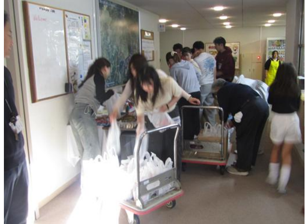
昭和医科大学、学生ボランティアの皆さん達による、ご提供品の袋詰め作業