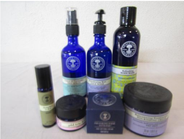
(株)ニールズヤードレメディー様より各種化粧品のご提供