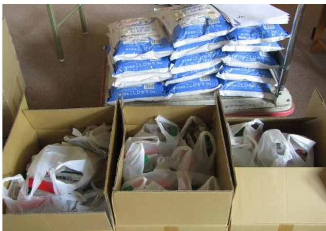
子供用、家庭用に区分けして