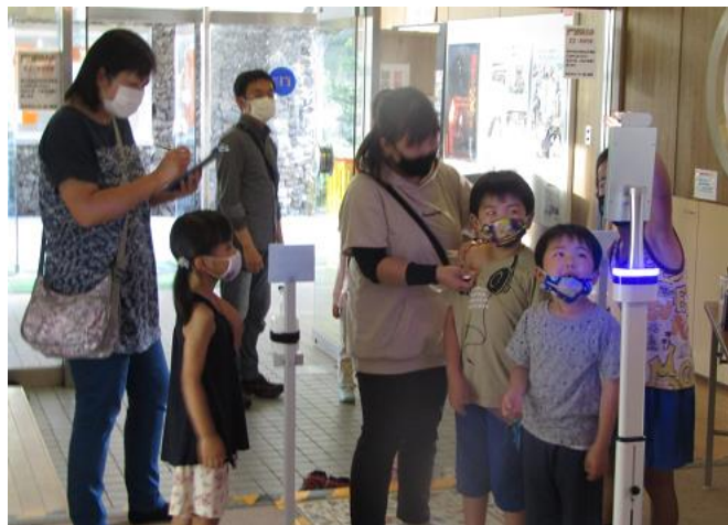
入館時の検温、体調、マスク着用確認