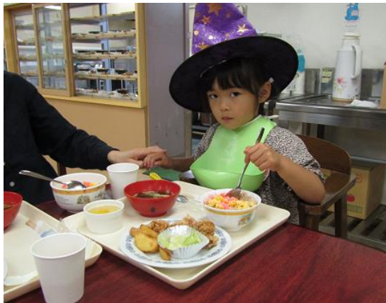
おいしい顔って、どんな顔？