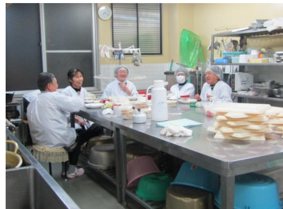
食育スタッフちょっと一休み