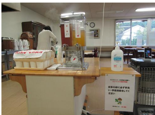
飲み物はサーバーと紙コップで提供